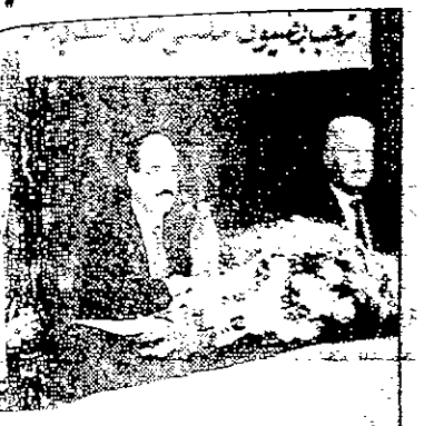
وزير الثقافة يترأس... تصوير: عبد الحميد

وزير الثقافة يترأس... تصوير: عبد الحميد • أمين عام جائزة تكوينية الكبرى للمعلمين (الذي كان لولا طائر أرم به تأخر السرب) الذي باركين العربي في رأسيات توتجة لجنة المنظمة والثقافة والأخ وة للجنة المنظمة في النجاح وتقدم تعزيز. التشويق احمد ناقة راعي الحفل أحيا في مدينتها سين والشعراء والحضور جميعا سعدني ان اكون سنة هذا التلقي بجة المباركة التي رقت. ولدينا هنا في ن- ونقتصر بها المعروف له الملك لله بن الحسين البيت الاطهار، وما يزيد بنجوم تيين وهذا سيرة جربة الكبرى من لوا على الثقافة فقر وقابته، وهكذا الاربن على أسس لأن الكلمة وراعية بنة ومشعل نور ول... ان المسيرة بجتها المثوية التي ك الحسين فتحت تسامحها المنظور معدنيا من شتى و اندام ومفكرين ة مسؤولة واداع تتماء ونشر الفكر